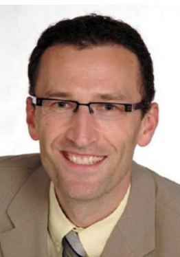
Holger Lehr Bürgermeister